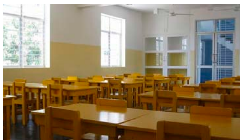
Na fotografii: Nová třída plně vybavená nábytkem

Rodiče a učitelé z Harrisonova centra péče o děti v Colombu jsou moc vděční za novou přístavbu školy IN Network, která byla postavena díky dárcům z Kanady