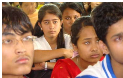
Fotografie: Děti sledují programy s velkým zájmem.

Plán do budoucna: nepálská děti chtějí další takový program připravit po 6 měsících. Připravují i program pro mladší děti, ale v jiné podobě.