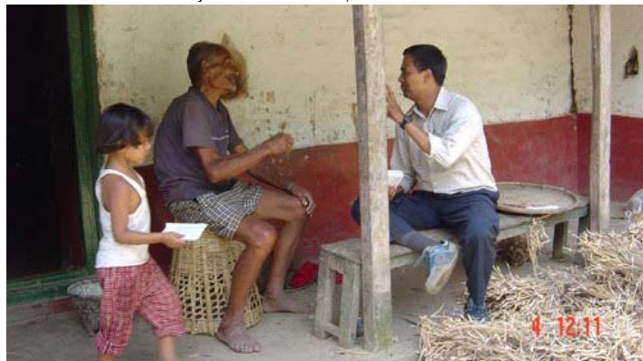
Na fotografii: Nepálský křesťan rozmlouvá s prostým mužem o Bohu.

způsobem neodradí. Je to jako apoštolé, kteří řekli: „Nemůžeme nemluvit o tom, co jsme viděli a slyšeli.“