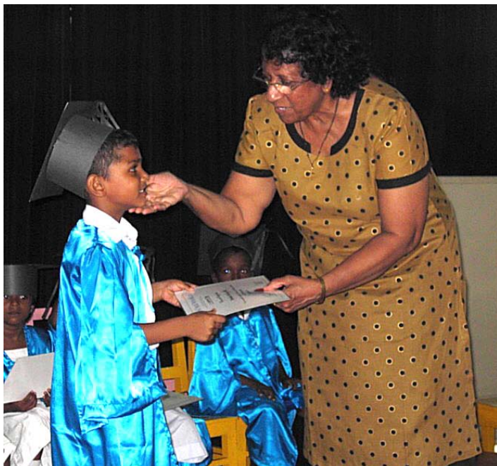
Foto: Ředitelce naší práce na Srí Lance už mnohokrát chtěli zakázat její službu lásky... ještě se to nikomu nepodařilo.

Proti přijetí zákona (ač ústava zaručuje svobodu vyznání) se mobilizuje pestré společenství mezinárodních iniciativ a organizací, mnozí křesťané se spojují k modlitbám. Je vážná obava, že zákon bude schválen. V zemi ale doposud a právě