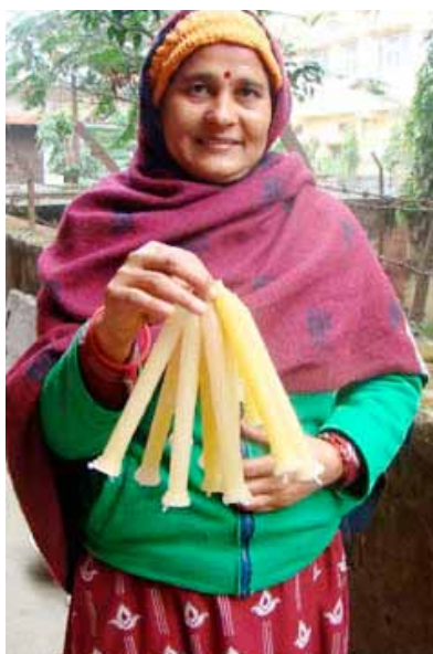
Foto: žena s vlastnoručně vyrobenými svíčkami

Po třech dnech se 30 účastnic terénního kurzu cítilo, jako by k sobě patřily již roky. Na výcviku byly ženy všech vyznání, ale všechny byly za kurz velmi vděčné a dokonce s ostatními ženami zpívaly chvalozpěvy a děkovaly Bohu. Také organizátorky nešetřily slovy vděčnosti za to, že mohou být tak užitečné mnohým dalším a děkují i dárcům, kteří jejich práci podporují.