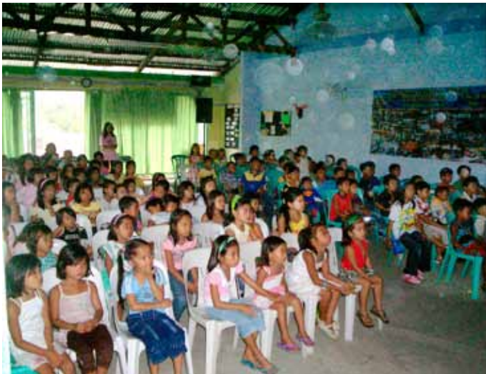
Na fotografii děti při vánočních slavnostech v místní církvi

Zatímco politické nepokoje jsou spíše lokální a nepředstavují hrozby velkého rozsahu, živelné pohromy, jak víte, citelně poznamenaly naše přátele, děti a rodiny, kterým na Filipínách pomáháme.