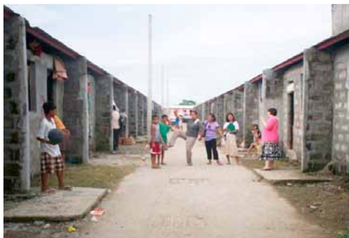
Foto: blok domů v Southville Santa Rosa pro obyvatele z Labas Bakod

Další podrobnosti a zprávy o povodních najdete na výše uvedeném odkazu.