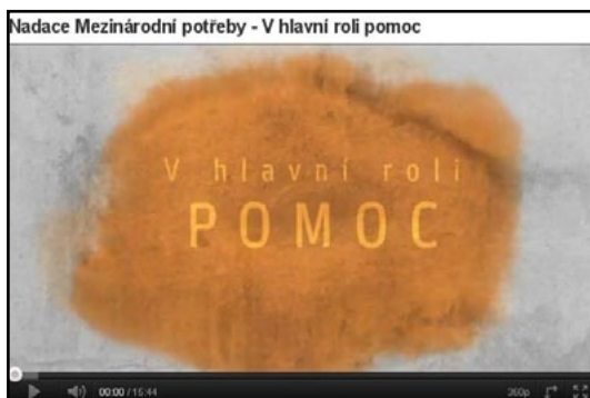
Video nahrané na serveru www.youtube.com

Kromě toho je mezi „účinkujícími“ také kostel Českobratrské církve evangelické v Praze-Braníku a sborový dům Jednoty bratrské v Dobřívě u Rokycan. Z filmu máme upřímnou radost.