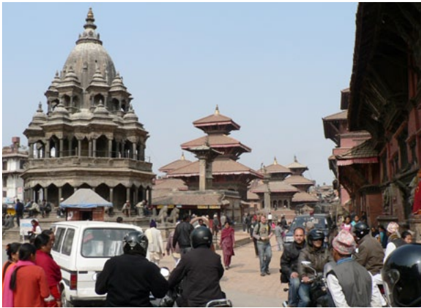
Hinduistické chrámy v Nepálu

Zdroje: http://mucednici.prayer.cz , www.nabozenstvi.com , http://cs.christiantoday.com , www.radiovicana.cz