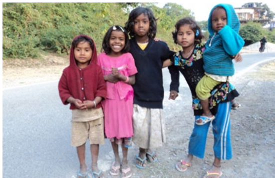
Děti z Dehradunu v severní Indii

Naše partnerské pobočky I.N. Network v Nepálu a na Filipínách prošly těžkým obdobím, jež přineslo proces ozdravení, jak Vás informujeme v další části Čerstvých zpráv.