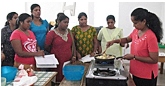
Kurzy pro srílanské ženy

Během těchto „Dopoledních setkání u kávy“ se navazovala přátelství. Ženy vyráběly tzv. „cutlets“ (rybí kuličky), které pak prodávaly, aby si přivydělaly. Učily se starat se o sebe a o své rodiny. Doufáme, že toto navazování přátelství bude moci pokračovat takhle často.