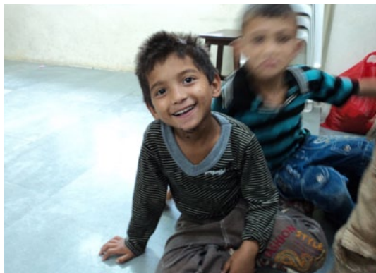
Chudý ale šťastný chlapec z oblasti Dehradunu

Nastal čas začít nové věci! Zahájili jsme Dálkovou adopci PLUS® v severní Indii – Dehradunu. V tomto městě a okolí žije přes milion Nepálců, kteří sem emigrovali v letech 1996–2006 během občanské války v Nepálu nebo přicházejí za prací. Všichni emigranti hovoří nepálsky a nazývají se nepálskými Indy. Chudoba v této oblasti je na velmi podobné úrovni jako v Nepálu. Některé rodiny žijí ve slumech, kde většinu „domků“ tvoří jen plastová střecha.