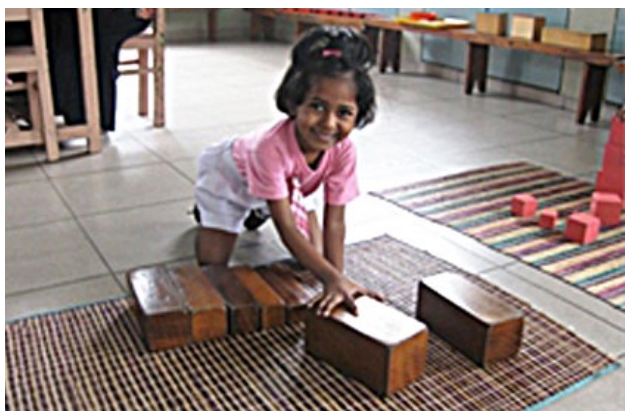
Srílanské dítě ve školce

„1. Jak využíváte aktivity a vybavení k rozvoji schopností dětí? Praktická cvičení, například přenašení předmětů, zavazování a rozvinování podložky nebo chůze po čáře, pomáhají dětem získat dostatečné sebevědomí, zlepšit koordinaci pohybů a zvýšit soustředění. Díky těmto cvičením se děti také naučí lépe ovládat, udržovat rovnováhu při chůzi nebo chodit bez pomoci do schodů a ze schodů. Děti, které se našeho programu účastní už od začátku roku, jsou vytrvalejší a jistější než ty, které se připojí teprve v průběhu, i když se třeba jedná o starší děti. V předškolním programu jsou děti také vedeny k samostatnosti. Dokáží se samy řádně obléknout, myjí si ruce a češou si vlasy. Pomocí krabičky s barevnými destičkami se učí rozpoznávat a pojmenovávat jednotlivé barvy. Vyhledávají tyto barvy ve svém okolí a při společném setkání pak ukazují na různé předměty a říkají jejich barvu.“