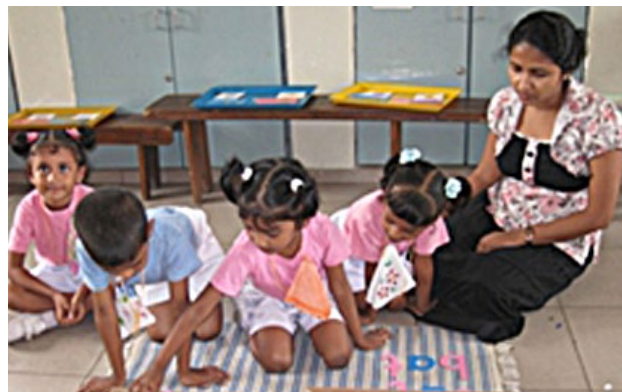
Děti se svou učitelkou

Myslím, že se jedná o velmi účinnou metodu sledování a hodnocení pokroku dítěte i učitele. Z tabulky je také jasné, kolik úkolů který učitel za dané období dokončil.“