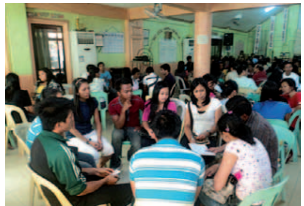
Účastníci jednoho ze seminářů

„V prvním čtvrtletí tohoto roku jsme mimo jiné pořádali semináře pro pastory církví a učitele dětských programů v různých částech Filipín. Ve spolupráci s organizací Operation Christmas Child (organizace pracující s dětmi) jsme pořádali výukové semináře ve městech La Union, Mindoro, Batangas a Marikina. Seminářů a workshopů se zúčastnily stovky pastorů a pracovníků dětské služby. Tématem seminářů byla biblická výuka a učednické programy pro děti. Účastníci si odnesli spoustu literatury a materiálu pro sebe i pro děti.“