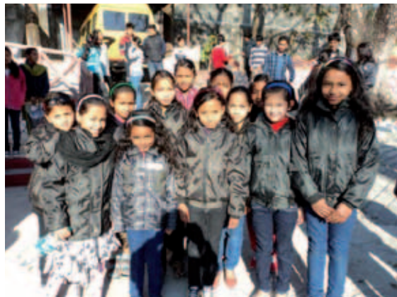
Děti s novými bundami