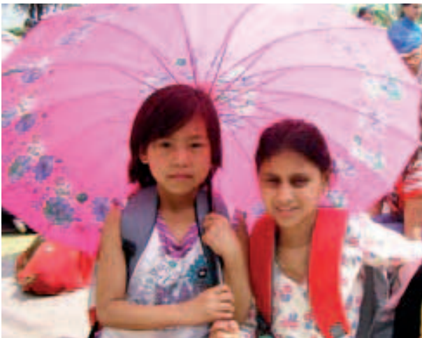
Děti s novým deštníkem.

pastu, ručník a mýdlo. Některé děti byly z dárků tak šťastné, že chtěly místo oběda jít domů ukázat, co dostaly. Mnohé z nich nikdy předtím dárek nedostaly. Jiné děti řekly, že jejich staré