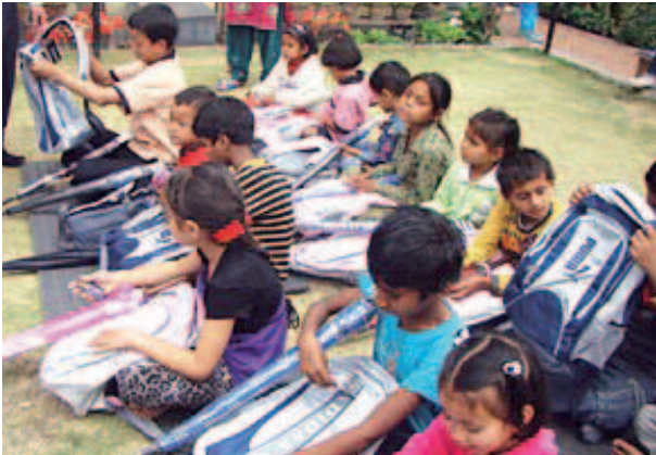
Děti si prohlížejí dárky.

Na programu byly písně, tance, scénky a rozdávání dárků. Každé dítě dostalo deštník, školní batoh, láhev na vodu, zubní