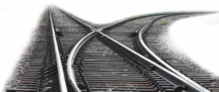
Náš program Zdravá mládež pomáhá správně nastavit výhybky v životě mladých.

Program Zdravá mládež letos vstupuje do 15. roku existence. V programu podporujeme 17 lektorů z celé ČR, kteří přednášejí na českých školách na etická témata. Od vzniku jsme na tento program poskytli téměř 19 milionů Kč. Dalších 21 lektorů, které jsme podpořili dříve, už nyní v našem programu není.