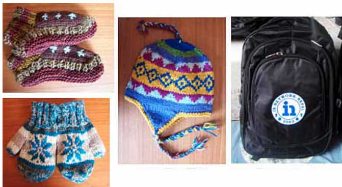
Tyto věci byly obsahem vánočních dárků v Nepálu.

Dárkový balíček obsahoval 1 pár vlněných rukavic, školní batoh, vlněnou čepici a pár vlněných bačkor. Ke konci slavnosti přicházeli dopředu různí lidé a vyjadřovali svou vděčnost za dárky a za podporu, která jim nebo jejich dětem umožňuje studovat. Na konci slavnosti si všichni užili společný oběd.