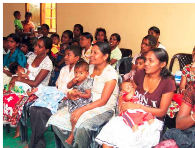
Program pro ženy s malými dětmi.

Děti během programu dostaly sklenici mléka a sušenky. Matky dostaly plastovou láhev a hrnečky pro děti včetně instrukcí, jak s obojím zacházet a jak to udržet v čistotě.