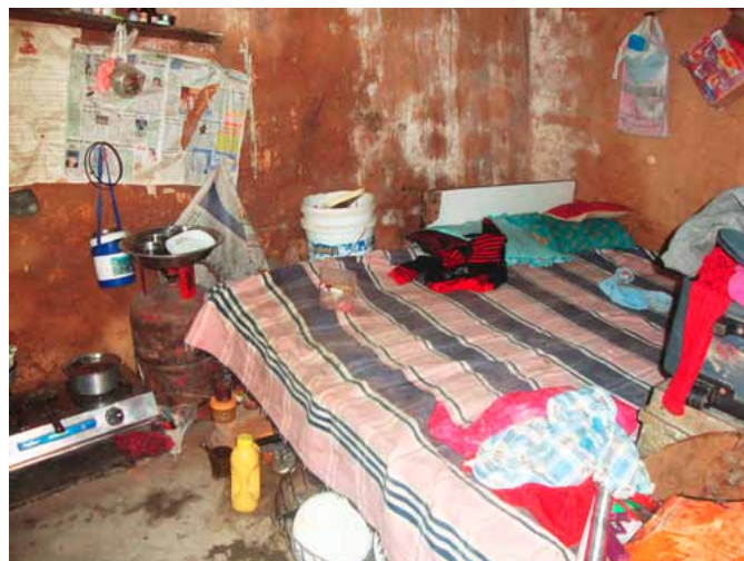
Tak vypadá „ložnice“ mnohých rodin v Dehradunu.