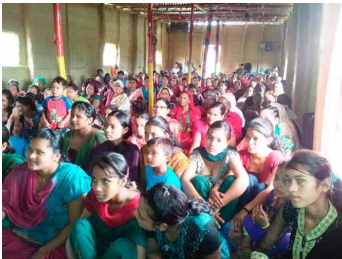
Setkání nepálských žen.

Když nějaká studentka dokončí biblickou školu, s největší pravděpodobností potom pracuje ve své církvi v Nepálu (případně v nepálsky mluvící oblasti v severní Indii). Může sloužit jako učitelka v nedělní škole nebo v různých službách určených pro ženy. Na to se právě studiem připravují.