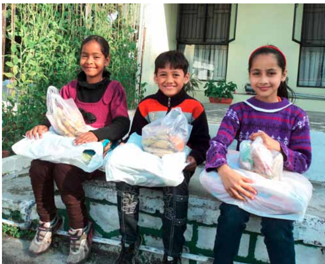
Děti se svými dárky.

Vánoční slavnost s dárky v International Needs (IN; dříve I.N. Network) v Dehradunu se uskutečnila 26. ledna 2013. Přišlo 150 lidí – dětí a rodičů. Děti předvedly nepálské a indické tance. Po krátkém programu se rozdávaly dárky. Každý dostal balíček, ve kterém byla deka, povlečení na postel a na polštář, sušené ovoce, čerstvé ovoce (banány, pomeranče) a sušenky. Děti měly z dárků velkou radost. Těší nás, že jste se mnozí zapojili a podpořili nákup dárků. Jedním z témat Vánoční sbírky 2012 byla deka nebo povlečení na postel pro indické děti.