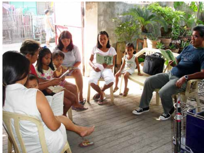
Lidé na Filipínách se scházejí ke studiu Bible.

fredo se zmiňuje o dalších malých skupinkách věřících v okolí, z nichž mohou vzniknout nové sbory. Spolu s tímto rozvojem duchovní práce přichází také sociální praktická pomoc lidem v těchto oblastech.