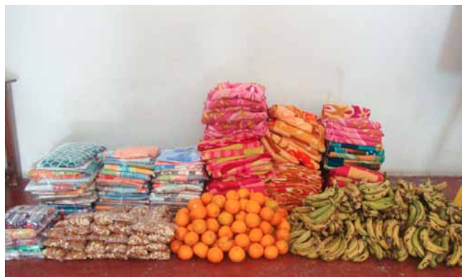
Dárky pro dehradunské děti.

Podrobnosti o sbírce najdete na www.incz.info/vanocce2012.htm .