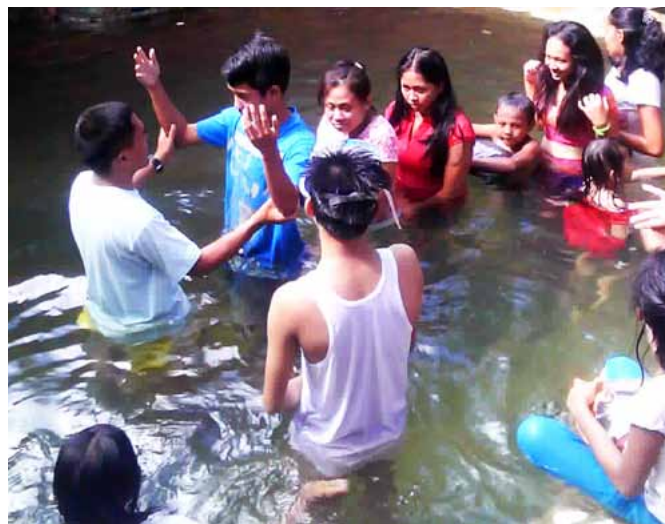
Noví věřící se nechávají křtít.