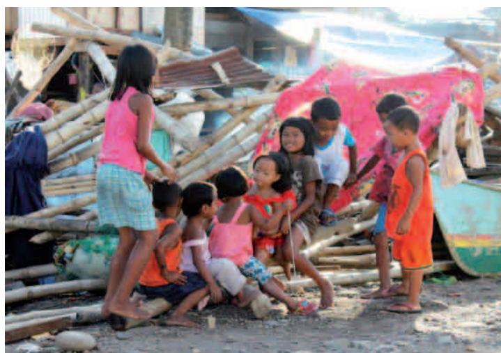
Filipínské děti si hrají mezi troskami po tajfunu.

těší nás, že můžeme ve spojení s Vámi i nadále konat stále rozsáhlejší práci jak v českých školách, tak v pěti zemích v zahraničí. Tato dobročinnost mění lidské životy a věříme, že nic z toho nepřichází nazmar. Doufáme, že i letos budeme moci rozšířit záběr této práce. Připravujeme projekt dálkové adopce ve zcela nové zemi, více o tom Vám však prozradíme později.