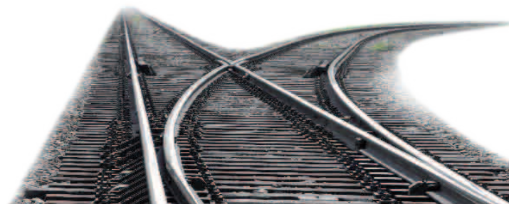
Náš program Zdravá mládež pomáhá správně nastavit výhybky v životě mladých.

Pro děti a mládež může být zásadní pomocí, když v rámci primární prevence uslyší přednášku lektora v jejich škole.