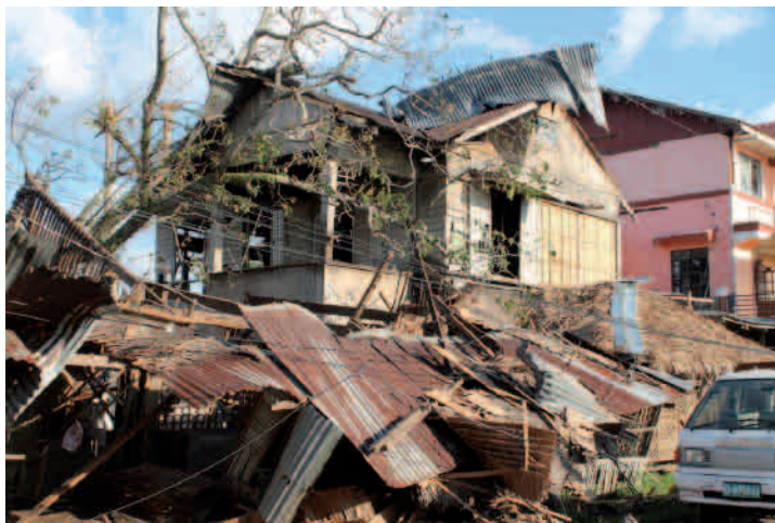
Tajfun Hayian zpusťošil také oblast Carigara na ostrově Leyte, kde bydlí děti v programu dálkové adopce.

Carigara leží na ostrově Leyte asi 50 km od velkého města Tacloban (od hl. města Manily je to vzdušnou čarou cca 800 km). Už jen dostat se do zdevastovaných míst, odkud se zároveň snažily uprchnout tisíce zoufalých lidí, bylo velice obtížné. Naši kolegové v následujících týdnech dopravovali do Carigary nejpotřebnější materiální pomoc a poskytli místním lidem také odborné psychosociální služby, tolik potřebné v těchto traumatických zážitcích.