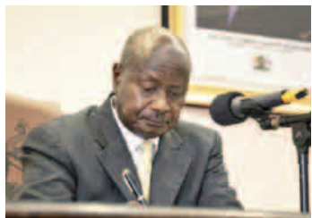
Prezident Ugandy Yoweri Museveni při podpisu zmíněného zákona.

Vedení Ugandy na tyto kroky reaguje s klidem. Podle autora zákona je to cena, která se musí zaplatit, a stojí to za to. Prezident Museveni tvrdí, že Uganda se bez cizí pomoci obejde a její rozvoj bude probíhat i nadále. Yoweri Museveni je prezidentem Ugandy již od roku 1986.