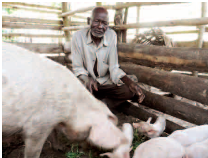
Skupina farmářů dostala dvě prasnice v ceně celkem 1 800 Kč. Během roku se narodilo 17 selat, jejichž cena je celkem téměř 15 000 Kč.

IN Uganda již mnoho let organizuje program na „zlepšení příjmu domácností“. V praxi jde zejména o podporu farmaření. IN poskytuje rodinám nejen hospodářská zvířata a plodiny, ale i potřebné nářadí, chemické prostředky a v neposlední řadě kurzy o efektivním chovatelství a pěstitelství. Program má určitá pravidla a motivuje lidi k vytvoření zemědělských skupin a vzájemné výpomoci. Například v roce 2013 vznikla skupina sedmnácti lidí, kteří přispívali do společného majetku a zároveň si z něj v nouzi půjčovali. Navíc získali podporu svého města a v tomto roce se k nim připojil ještě více lidí. Jiná skupina se zabývá pěstováním rajčat. Díky seminářům a darovaným prostředkům proti škůdcům je jejich úroda až o 50 % vyšší.