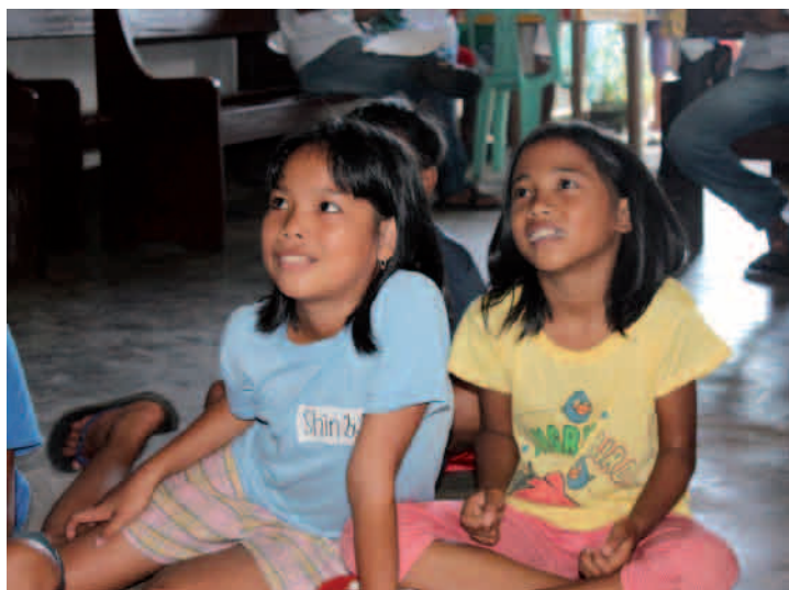
Programy pro děti, které zažily řádění supertajfunu.

Od konce prosince až do konce března 2014 probíhala třetí fáze pomoci. Nyní šlo hlavně o dodání stavebních materiálů, díky kterým si rodiny mohly opravit nebo zcela nově postavit skromné přístřešky. Toto byla nejnákladnější část pomoci a byla možná jen díky soucitu a solidaritě zahraničních dárců.