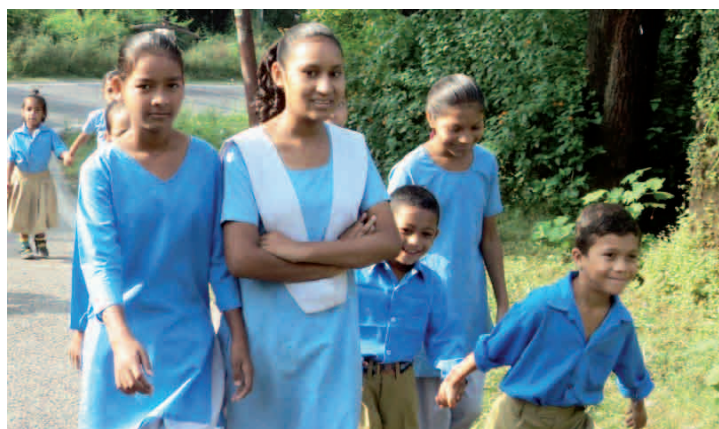
Školáci v Dehradunu na severu Indie.

Každých několik vteřin zemře na světě jedno dítě v důsledku extrémní chudoby – kvůli hladu, nedostatku pitné vody nebo na nějakou nemoc.