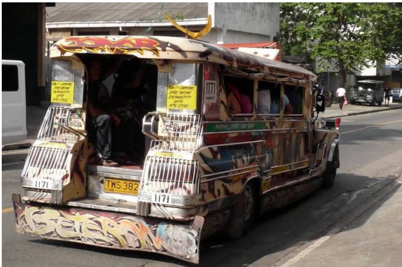
A takhle také cestují děti do místní školy.