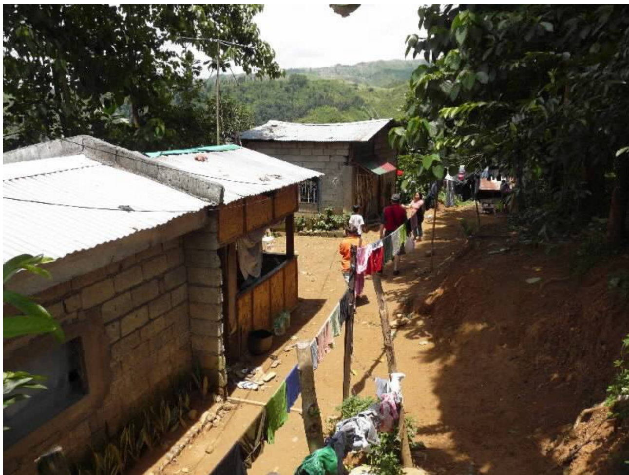
Cesta k domku Calimpových

Záznam výroby špejlí si můžete prohlédnout: www.youtube.com/watch?v=3MGFMloQu0I