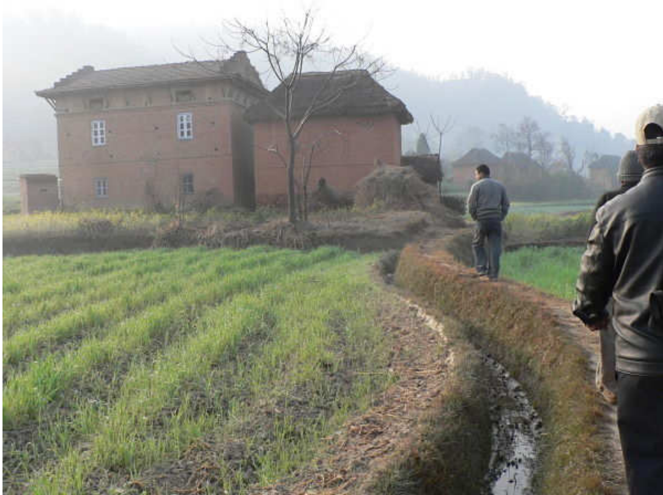
Cesta k domu Saliny vede po mistrně zbudovaném náspu vedle zavlažovacích kanálků.