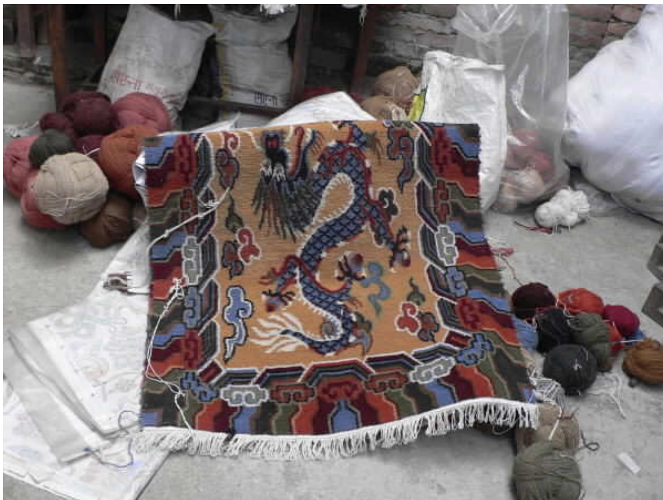
▲ Nahoře hotový výrobek, dole rastr, podle něhož se tvoří vzor. ▼