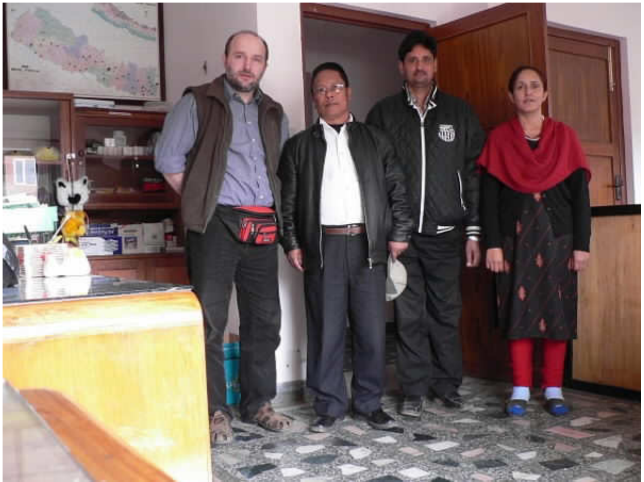
▲ Tři lidé vedle mne (notně ošuntělého po týdnu v Nepálu... – ☺) řídí program podpory pro více než 400 dětí, téměř polovina jich je mimo údolí Káthmándú. Ale i zde je někdy velmi obtížné dostat se do některých částí, jak jsem se mohl přesvědčit...