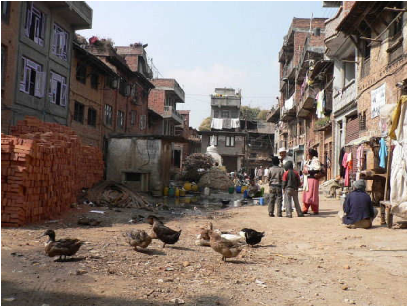
▲ ▼ Lidé žijí na ulici, mnoho žen si mylo vlasy, jiné vyklepávaly rohože (dole). Nejde to moc dohromady, že?